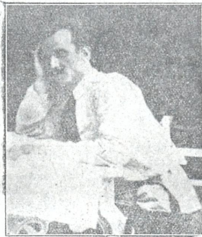
გიორგი ნოშვილი (1883—1920) (იხ. წერილი ამავე №-ში „უიქი საქართველოზე“)