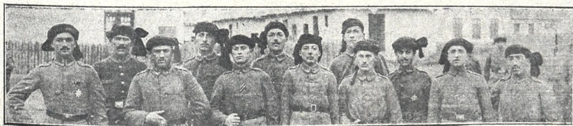
რუმინიაში მყოფი ქართველთა ლეგიონერები