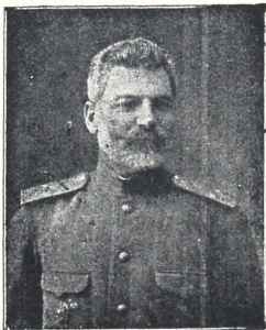
გენ.-მ. ალ. ი. კობიაშვილი

ობოლოთ ობოლი, რგალი ობოლიო, რომ უტავით, სწორედ ალ. ი. კობიაშვილზეა ნათქვამი, რომელიც ამ ორის თვის წინად მოულოდნელად გარდაიცვალა. ეს იყო ობოლი არა მხოლოდ დედამამით, არაჟედ სწავლა-აღზნით, სამსახურით, მოლოდინდევლობით, საზოგადოებრივ მოღვაწეობით და „შეოლ სიცოცხლეში“ თითქმის ობლოდ იარებოდა.