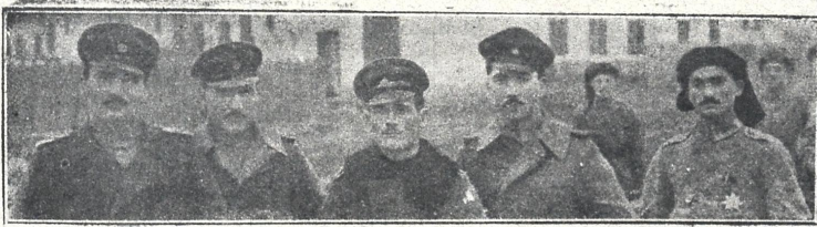
რუმინიაში მყოფი ქართველთა ლეგიონის ოფიცრები