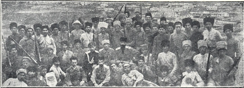
და რ ი ა ლ ი ს ხ ე ო ბ ი ს მ ც ვ ე ლ ი მ ო ხ ე ე ნ ი