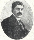
ხერგო პეპანოვი ნამავადრი სკენისმთ ყვარე, ვარდალ. იან.

სხმაურდა მშოლოურ პანგზე არემარე და თვით ზეცა, მზის სხივდის ფერი ჩანგს ქარავენ, იცინიან ხარობს მზეცა; რაზმი რაზმმა მოსდევს მწყობრთა, გრძობის ალი გულზე მცესა: ახ! სადა ხარ სიკამუტეკე, მინდა ვიყო მათთან მცესა... ნიაფი ჰქრის, დროშას არხვეს ესაღმება ზურმუხტ მდელიოს, გაზაფხულის დღეს ულოცავს თავის; ფალ საქართველოს! გეშა მიხ. დევაძე