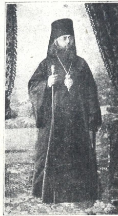
ლეონიდ კათალიკოს-პატრიარქი მცხეთაში კურთხეული თებერვლის 23.