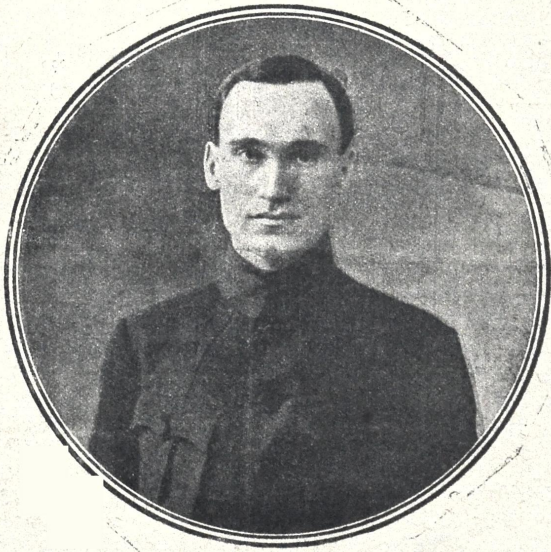
შალვა ნიკოლოზის ძე მაღლაკელიძე თბილისის საგუბერნიო კომისარი, ქ. თბილისის და შორაპლის მაზრის გე- ნერალ-გუბერნატორი. (იხ, ცნობა 18 გვ.)