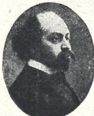
კომპოზიტორი დიმ. გვ. არაკუშვილი ოპერა „თქმულეობა შოთა რუსთაველზე“-ს დამწერი. სამუსიკო მოღვაწეობის 15 წ. შესრულების გამო.

1919 წ. № 2 კვირა, მარტის 2. ფასი 3 მან. წელიწადი მეშვიდე გამოცემისა მიიღება ხელის მოწერა 1919 წლის თურნალ „თეატრი და ოპერა“-ზე წლიური ფასი 25 მან.