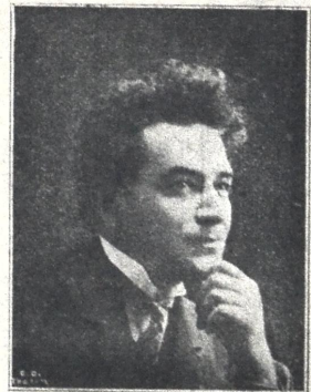
ს. ი. ივლახიშვილი სახელმწიფო თეატრის ანტრეპრენორი.