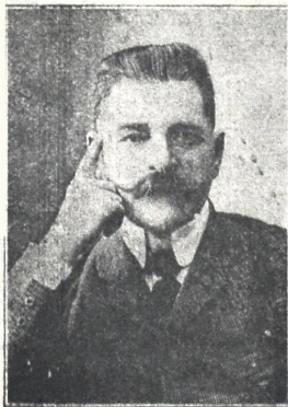
ირაკლი წრაკვიძელი გარდაიცვალა მარტის 2-ს ლადაიხში.