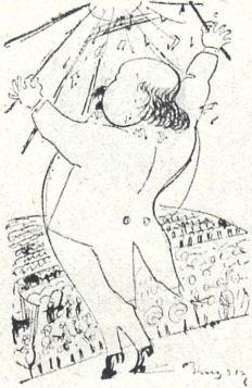
კომპოზიტორი დიმიტრი არაყიშვილი (ძველის შარჟიდან ნახესხი) ხმამან ჩემმან მინც უწია სამშობლოსა ჩემსა!..