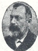
სოფ. მგალობლიშვილი გორის მსხ. ერთბაშაში იმამ-წიგანის მამრ.-წინამძღოლად.

რწმენს კნაჩე გავაბი საყვარულის სიკებო პოეზიის ვარდ-ნარი მოვრწყევტა მნობის წვიმებით. მბუღიდა სარღერა აღმტყინი, ღვთაურნი: ბროლი-მანგების ღვთაურნი უზენაეს, ცოცხლით. დავატყვევე ირემი მთის ორწოხნი მყვარალა, ავატირე სიბი კლდე სღვის სერცისკენ მზირალა.