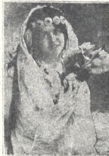
მ. ი. ზავერჯანისი სახელმწიფო თეატრის პრიმა-ბალეტისა, ცნობილი მოცეკვავე.