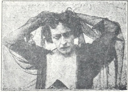
ინაშვილი ახალგაზრდა ჯაღპერა მსახიობი—ღმრთი.

ნ. კაციაშვილი ს. გომის (გორის მახ.) მცხოვრებ მღვდარი გლჱის შვილი იყო დაახ. 40 წ. სწავლა დაამთავრა სათ.-ახ. 4-კლ. სასწავლებელში, პირველ მოწ. ხნგრძლივი ველმყოლობის გამო სწავლა ვერ განაგრძო, რუსულ - ქართულ პოლიტიკურ წიგნების კითხვასადაეწავა და ცხოვრებას მსლი