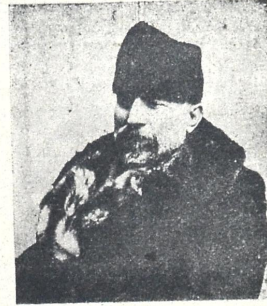
ნიკოლოზ (კარლო) სვიმონის ძე ჩ ხ ე ი ძ ე

ნოე ნიკოლოზის ძე უორდანია საქართველოს დამფუძნებელ კრების მთავრობის თავმჯდომარე, საქართველოს უმაღლესი წარმომადგენელი. თავმჯდომარედ არჩეული მარტის 12.