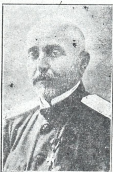
გენერალი ილ. ოდიშელიძე

ცნობილი სამხედრო მოღვაწე, ნიჭიერი და მკობნე მხედარი, რესპუბლიკის სხვადასხვა დავა ლებთან და დიდის უნარით აღმასრულებელი. გასულ თვეს თბილისში ვერის დაღმართზე გენერ. ბა- რათოვთან ერთად ავტომობილით მგზავრობის დროს ყუმბარით დასტრეს. ამ უამად უკეთაა.