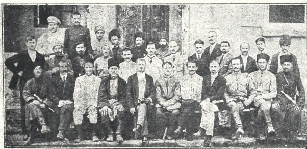
ბორჩალოს სამაზრო ერთის 1 ყრილობა.