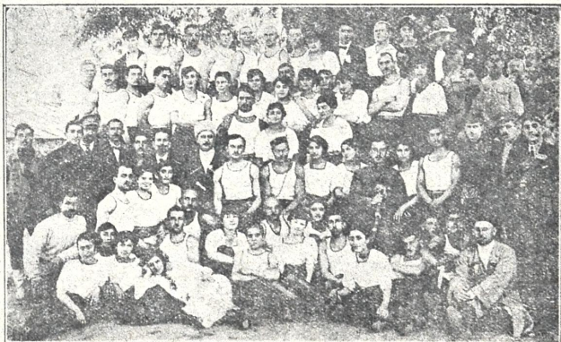
სახ. „შევარდენის“ გამოსვლა 5 ოქტომბერს 1919 წ. ქ. ქუთაისში. 1 გ. მწაწიის ეზოში.

ვის არასოდეს ქართველთა სამხედრო კავშირი, პლ. ირ. ლეჟავას თაოსნობით რევოლუციის პირველ დღეებში ქ. თბილისში დაარსებული (1917 წ. 13 მარტიდან) კავშირმა, სხვათა შორის, იმ თავითვე მიზნად დაისახა ჩვენი ახალი თაობის ფიზიკური განვითარება. ამ მიზნით დაარსა ტან-ვარჯიშობის სახ. „ამირანი, როდესაც საქართველოს დამოუკიდებლობა გამოცხადდა „ამირანი“ გადაკეთდა „შევარდენის“ საზოგადოებად-საზოგადოებამ თვის განმავლობით მთავრობის განსაკუთრებულ ყურადღება დაიმსახურა და შევარდენის ხელმძღვანელი გ. ეგნატაშვილი დაინიშნა განათლების სამინისტროს ფიზიკური განვითარების მთავარ გამგედ.