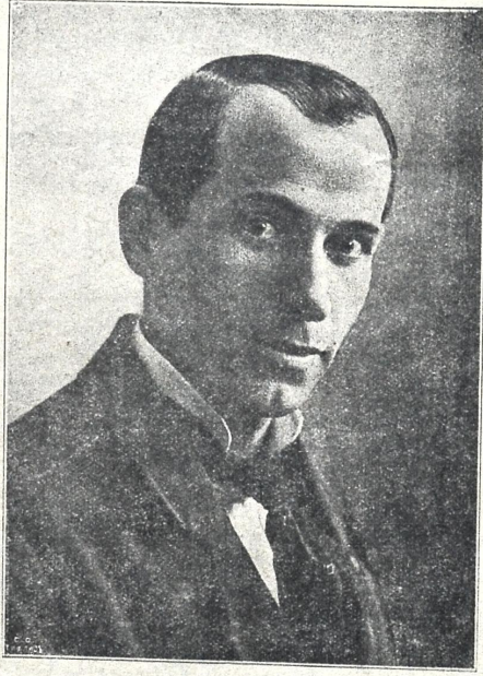
გადიერი ჯვარი იძი ახალგაზრდა ნიჭიერი მომღერალი მერის შემსრულებელი.

გულს კვლავ სწიწანის შავი ფიქრი, გულს ეუფლა მწარე ურვა ისევ ისმის ჩუმი თოთქმა! ისევ ისმის ბედის მღურვა: თითქმის ყველას განუყრელად, თან ზღვეს ძველი სახის კმუნვა დლიურ კიბავებს თ ნვე ახლავს ცრმლ ნარვეი წყვევა კრულვა! აქ კვლავ სუფევს კაცთა შორის სიძულვილი, შური, მტლობა. აქ კვლავ ფეხ-ქვეშითელება პიროვნების საღი გრძობა! აქ კვლავ დადის თავის ფეხით ერთმანეთის მწარე გმობა; აქ ერთმანეთს არ ინდობენ, ერთმა-ეთის არ აქვთ ნლობა .. გაიგონეთ! აღ რ ძალმძის აღარ ძლ-მ ძს ყოფა მწარე! მღბრუქს მიკერს ეს ცხოვრება ვერას გზით ვერ გავიხრე! წამიყვანეთ იმ ნხარეში! წამიყვ ნეთ, მალე, მალე! ვერ გაუძლებ ამდენ ტანჯვას, დავიქნცე, დავილაღე! დ. ზანათელი