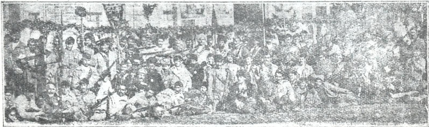
სოფ. ზაშვის [გარეკახეთის] გვარდია