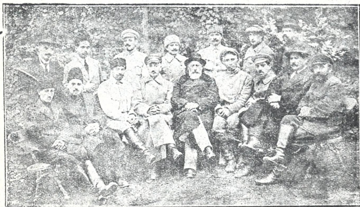
სახალხო გვარდიის მთავარი ოფისი

(სახალხო გვარდიის დღესასწაულის სახსოვრად)