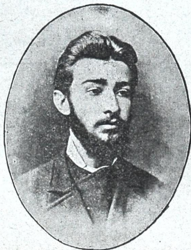
მწიგნობარი ილია ხონელი (ბახტაძე) (გარდაცვ. 10 წ. შესრულების გამო. † 13 ივლ. 1900 წ.)