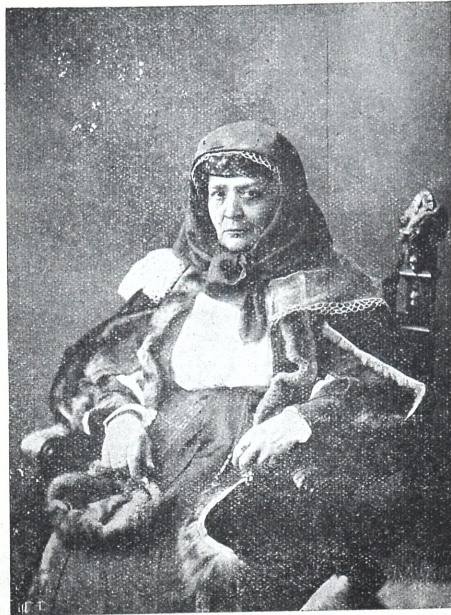
მ. მ. გაბუნია-ცაგარლის ხანუმას როლში