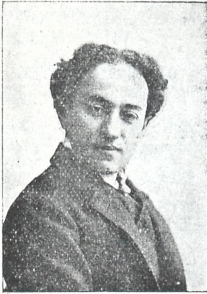
სომხურა დრამატ. დასის რეჟისორა მსახიობი ა. არმენია

და რა მექნა? რომ ღმერთი გამწყრომოდა და თეატრი დამხუტოდა, ქვეყანა ყბად ამიღებდა, ისე გააქრო და გაათავა კაცი, რომ ერთი ღოხ-ცური არ აღირსაო, იტყოდენ.