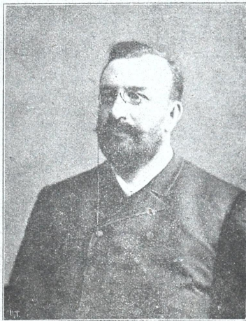
თ. დავით გიორგის 'ქე ერისთავი („სამშობლო“ ს. ავტორი)

ქართული თეატრი დღეს და სამუბათს 28 ენკ. სამეოვლო დავ. ერის- თავისა ვ. შალიკაშვილის რეჟისორობით