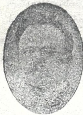
თამაზლომარე აკაკი ჩხენკელი