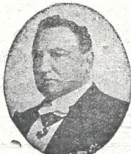
ნ. ვ. შუშუბათი- შვილი მოდეწ. გამო,