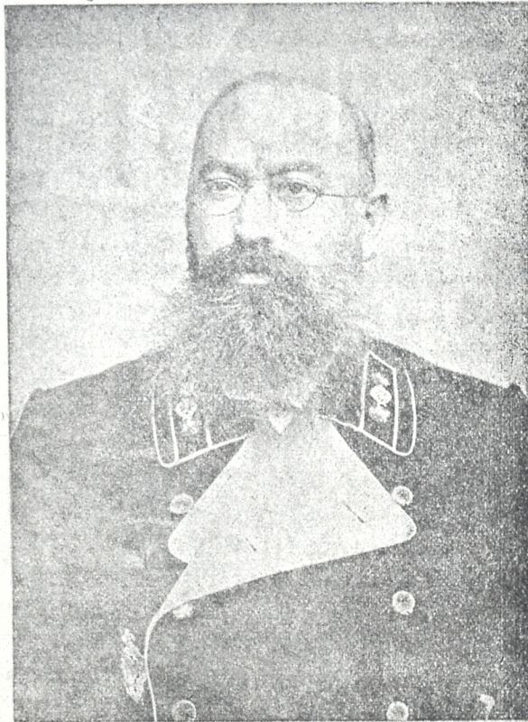
ისტორიკოს-არქეოლოგი თედო შორდანია

გარდაცვალებიდან ერთი წლის შესრულების გამო. დღეს, დეინობისთვის 22 დიდუბის ტა- ძარში მისი წირვა-პანაშვილია.