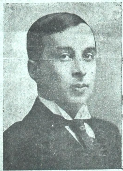
რეჟისორი ვ. ჯვალისვილი (1884—1924)

კობე მისნი როლებში გარდაცვალებიდან 10 წლის შესრულების სახსოვრად