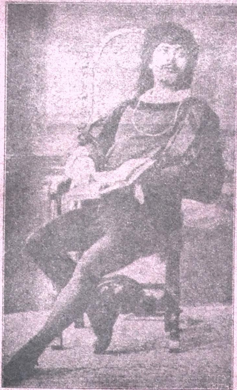
მენე სიული საფრანგეთის გამოჩენილი ტრაგიკოსი, პამლეტის რედაქტორი, ქ. 19 თებერვ.

მიიღება ხელ.ს მ რ წ მ ა 1916 წ. უზრ. თეატრი და ცხოვრება წელიწადი მეოთხე. (იხ. № 4 გვ.)