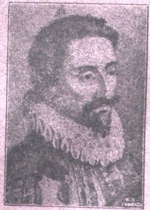
მიგუელ ხერვანტესი ისპანიის სახელგანთქმული მწერალი „ლონკინოტის“ დამწერი, (გარდაცვალებიდან 300 წ. შესრულე- ბის გამო).