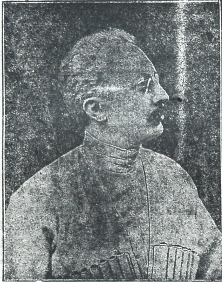
მოსვენება მხლოდ მკვდრებს შუაფურის, ცოცხლებს კი გარჯა და ტანჯვა!..

სემორე მოუგანილი სიტუაციები იმ კაცმა სთქვა, რომელსედაც თქმის სხვისა მახიარებელი მოკვლა უზიარებელიო!