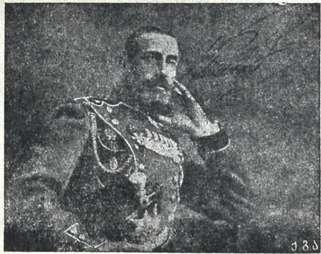
დრამატურგ მგოსანი მ. ი. უ. დ. მთ. კონსტანტინე (კ. რ.) იგივე იოსებ არიმათიელის როლში გარდაცვლებიდან წლის თავის შესრულების გამო.