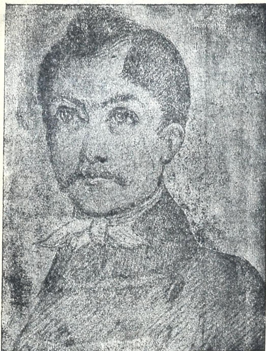
მგოსანი ნიკოლოზ ბარათაშვილი

ნახატი ალ. ჭმრეელიშვილისა (წელს უსრულდება დაბადების 100 წ.)