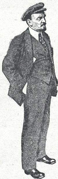
3. ი. ლენინი

გარდაცვალებიდან ერთი წლის შესრულების გამო (წერილი ილენინი და ხელოვნება“ იხ. შემდეგ ნომერში).