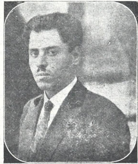
ს. ილორელი. სანიტეატრის პირველთავანი მსახიობი