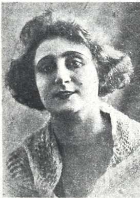
არნაზი სკულპტორის როლში.

კ. მარაჯნიშვილის დადგმა, სკენარი შალვა დადიანისა, გაოცქმა სო. კ. ჟურნულ. კომისარიატისა.