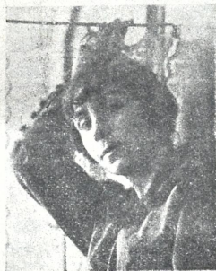
მ მ ა რ გ ო სანიტეატრის პირველთავანი მსახიობქალი

სანგანათლების განყოფილებამ ქართულ ენზე გამოსცა სანგანმანათლებლო პიესათა კრებული, სადაც მოთავსებულია 14 პიესა, ინსცენაროვკა და გასამართლებანი 5 დიმივისა, ს. წერეთლის, ექ. ვილიისა და ზუნთურდიისა. —ედვა.