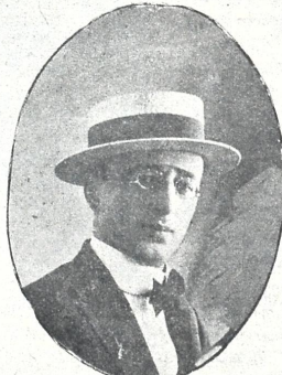
სენო წერეთელი დასის გამგე და სანიტ. პიესების ავტორი