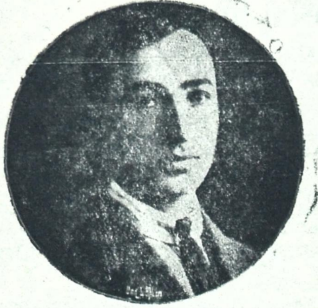
პ ა პ ა რ ა ე .

პაპარე (პაიე პეტროსიანი) დაიბადა 1895 წ. 2 თებ. ახალ ბაიანეთის ერთი გლეხის ოჯახში. საშუალო განათლება მიიღო ტუ. სომეხთა ნურსესიანის სკოლაში. მწერლობის დიფენდა ბავშობიდანვე. სამწერლო ასპარეზზე გამოვიდა 1912 წ. ექიმ გ. ჩეიზიანის ყოველკ. ჟურ. „სინათლე“-ში ლექსებით. შენდევ ლექსებს გარდა სწერდა პატარა მოთხრობებს, პოლს რეცენზიებს, კრიტიკულ შენიშვნებს და სხ. თანამშრომლობდა ყოველ სომხურ ჟურნალ-გაზეთში. მისი ნაწერების შინაარსია სოფლის ყოფა-ცხოვრება. დაწერილი აქვს პიესებიც: „შემოსართელი“ დრ. 3 მოქ., „ხატის მონა“ დრ. 3 მოქ., „გიულიზარ“ მუსიკ. დრ. 5 მოქ. (მუსიკა დასწერა სომეხ. ახალგაზრდა მუსიკ. ე. ტალიანმა), „საერთო კრება“ ვოდ. 1 მოქ. ყველა ეს ხშირად იდგმევა სომხურ სცენებზე, უმთავრესად უკანასკნელი, რომელიც თითქმის ხალხურ ანდაზად გადაიქცა.