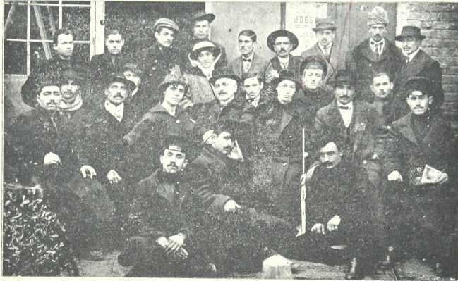
საბურთალოს სასახლო თეატრის სცენის მოყვარენი (წარმოდგენები დაიწყეს 15 თებერვალს)