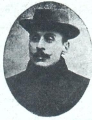
რეჟისორი კ. შათირიშვილი