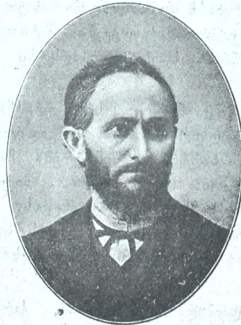
ნიკოლოზ ლომოურის ძე ლომოური (1852—1915)

განისვენე მშვიდათ, შენის შრომით უკვდავთა შორის ჩარიცხულო, ძვირფასო მოღვაწე!