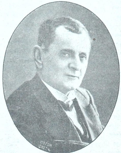
სიჭაბუკის სურათი, 1879 წ. გადაღებული.