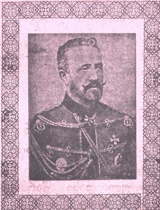
მ. ი. შ. დიდი მთავარი ნიკოლოზ ნიკოლოვიჩი - ამ მათი შვიდგზისობის მოადგილე და კავკასიის ჯარის მთავარ-სარდალად დანიშნული 23 აგვ. 25 აგვ. საღამოს 6 საათზე გამოემგზავრა საქართველოს.