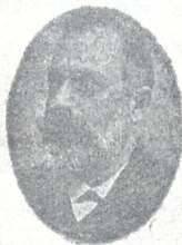
ს. ს. მგალობლიშვილი. მწერლობს 1872 წლიდან

გსურთ ჩაიხედოთ ჩვენი გლების ცხოვრებაში, წარმოიდგინოთ რა ლამაზი სულის პატრონი იყო იგი, დღეს უსამართლობისა და უცხო გავლენისაგან ფეხქვეშ გაქედილი, ?!.