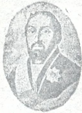
გიორგი მერაბიშვილი (1798—1800)

ვერ მიხვდეს, რომ იმისი სასტიკი მწვერავები ხართ... და თუ შევამჩნიათ, ხომ იცით, ფიცხია და გულის მოსვლა ადვილად იცის... მაშ აგრე, ფრთხილად იყავით! (დაუკრავს თავს, ესენიდ ღმრსა საღამს მისცემენ და გაუფენ)