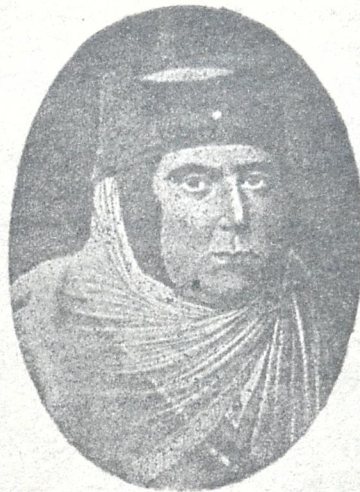
დარეჯან დედოფალი სამეგრელოს შთავრის დადიანის ასული, მეფე ერეკლე II მეუღლე.