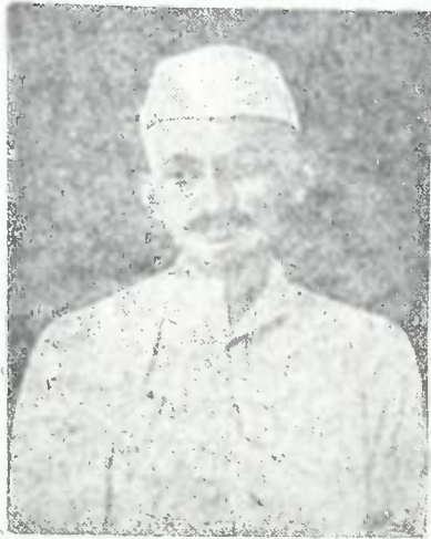
გ ა ნ დ ი

წარმოდგენა განდის შესახებ, როგორც რევოლიუციონერზე, სრულიად ყალბი წარმოდგენაა. ის