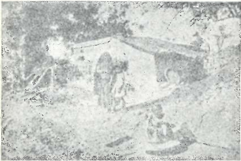
ტალახისა და თიხისაგან გაკეთებული ქოხი

ბენჯაბში, ბენგალიაში — ყველგან სწარმოებს იგივე ბრძოლა არსებობისათვის, ყველგან უმუშევრობაა, გლეხები ყველგან შიმშილობენ, ყველგან მცირე ხელფასია და დიდი სამუშაო ღირს სოფლის მოჯამაგირეებისათვის. ყველგან დიდი სასოფლო-სამეურნეო