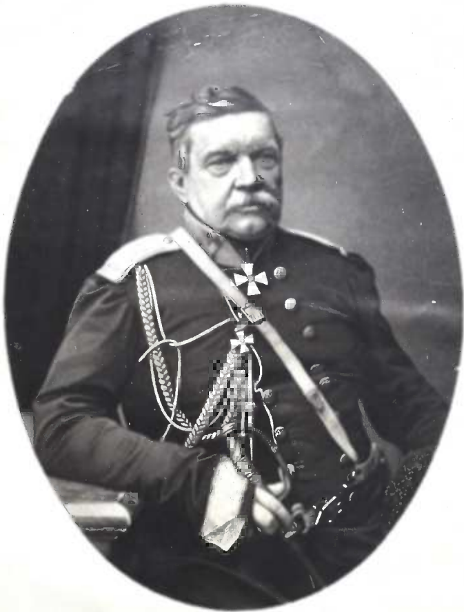
Фото-Литография Штерля, Насгольцъ и К о въ Москвѣ.