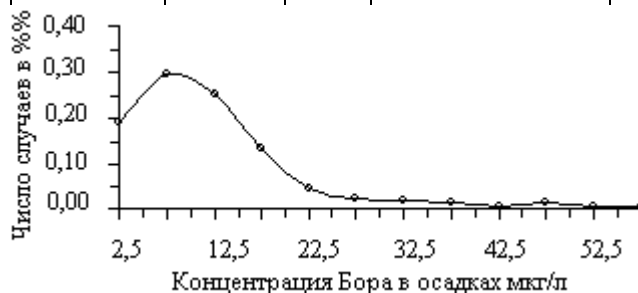
Рис.1. График распределения плотности вероятностей значений концентраций элемента Бора в атмосферных осадках Кахетинского региона

В табл.2 приводятся значения коэффициентов линейной корреляции между величинами концентраций суммы главных ионов и некоторых микроэлементов в осадках Восточной Грузии